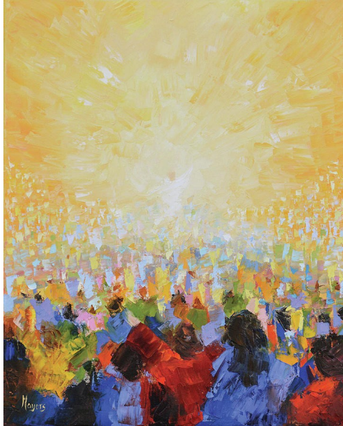
Llun: 'Haleliwia!' gan Mike Moyers: mike-moyers.pixels.com